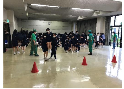
2年生 担架搬送訓練（毛布担架、組み立て担架、徒手搬送）