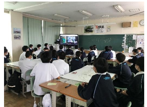
3年生 避難所開設図上訓練（リモート）