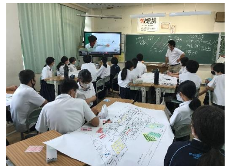
3年生 避難所開設図上訓練（リモート）